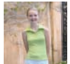
Exif Print – AKTIV Originalgetreuer Ausdruck der Bilder unter Berücksichtigung der Aufnahmedaten.