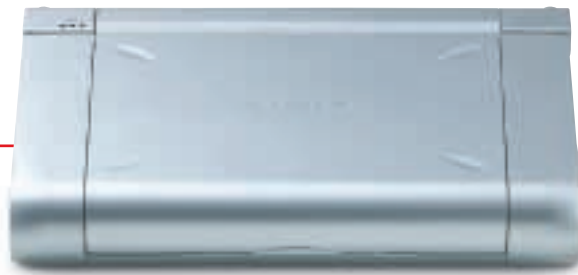
i70 mit optionalem Akku