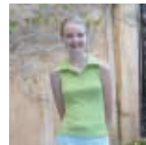
Exif Print – DEAKTIVIERT