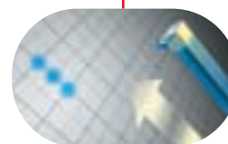
Advanced MicroFine Droplet Technology™