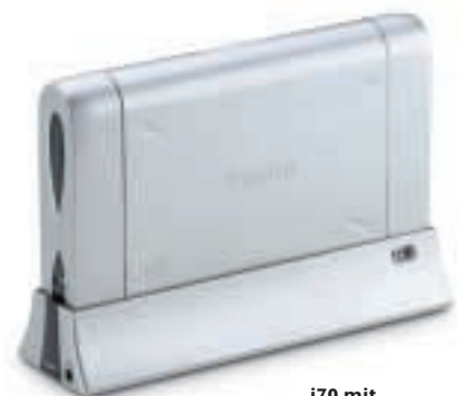
i70 mit optionaler Ladestation